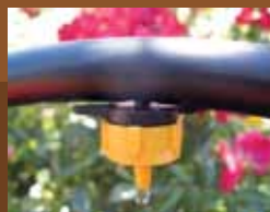
Especialmente formulado para goteo