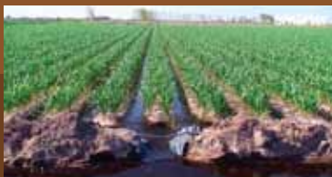
A canal de riego