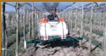
Subsolado en línea