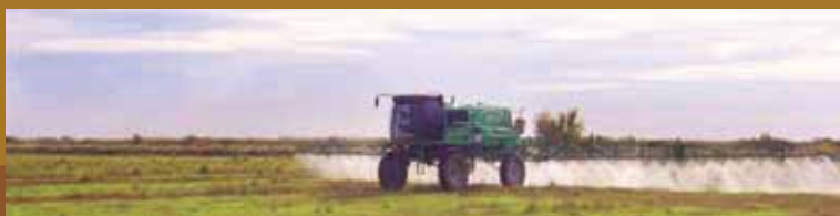
Aplicación foliar a gran escala