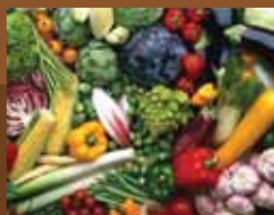
Altísimos rendimientos en frutales y hortalizas