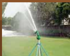
Aplicaciones productivas y ornamentales