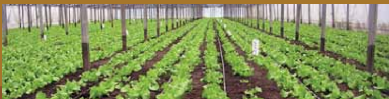
Goteo bajo invernadero